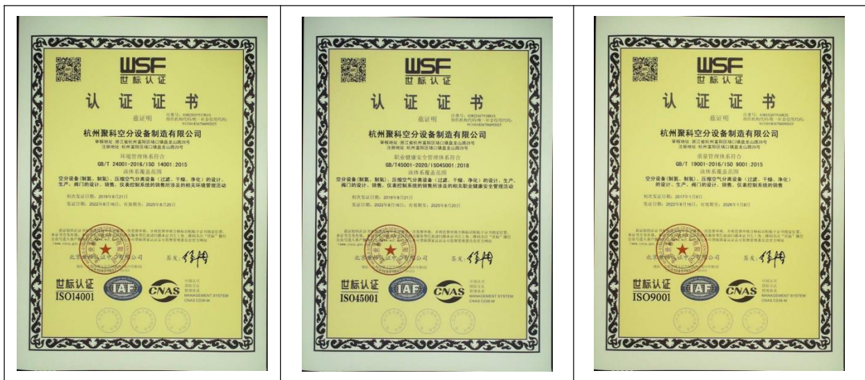
环境管理体系证书

公司顺利通过了并获得 ISO9001 质量管理体系认证、ISO14001 环境管理体系认证、ISO45001 职业健康安全管理体系认证。并准备开展“浙江制造”品牌认证，公司将严格按照国际质量管理体系执行，使企业产品的质量得到有力的保障，从而使企业“科学发展观 创行业一流”的质量方针得以顺利推行。自建厂以来，公司从未出现过重大质量投诉，在历年接受各级质量生产管理部门的抽检中，合格率均达 100%。